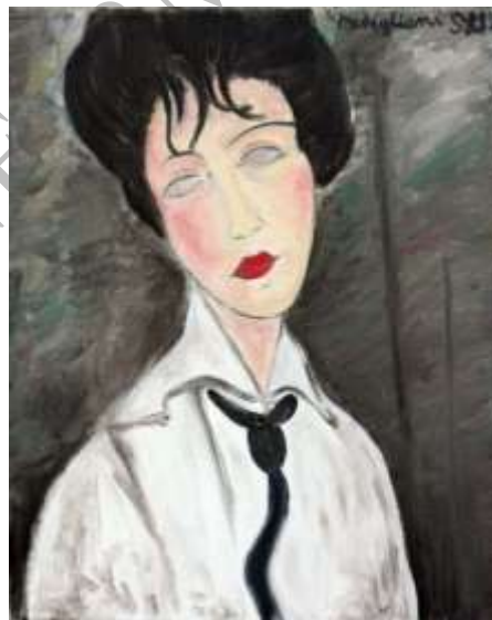
Amedeo Clemente Modigliani, Femme à la cravate noire , 1917

Dans ce portrait Modigliani représente une femme dont l'émancipation est suggérée.